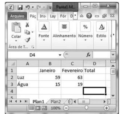
Janela do Excel 2010

As figuras acima mostram janelas do Word 2010, do PowerPoint 2010 e do Excel 2010. Com relação a essas janelas e a esses programas, julgue os itens subsequentes.