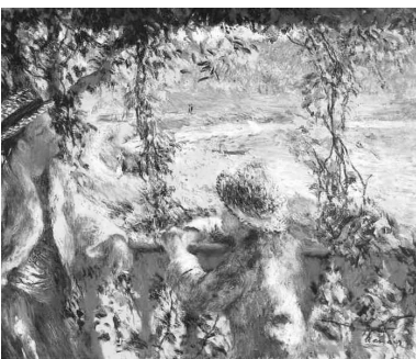
Pierre-Auguste Renoir. Junto ao lago.