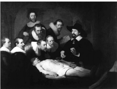
Rembrandt van Rijn. Aula de anatomia.