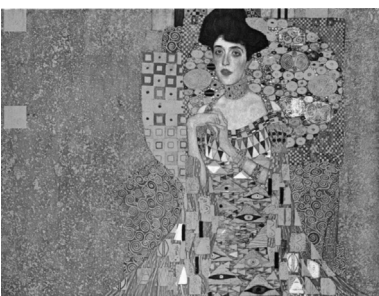
Gustav Klimt. O retrato de Adèle Bloch-Bauer.