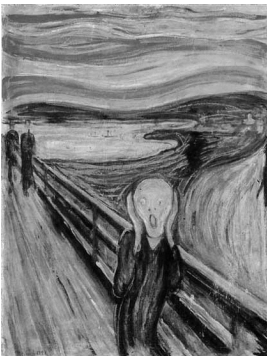
Edvard Munch. O grito.

Assinale a opção que apresenta a imagem que melhor caracteriza as noções descritas no texto acima.