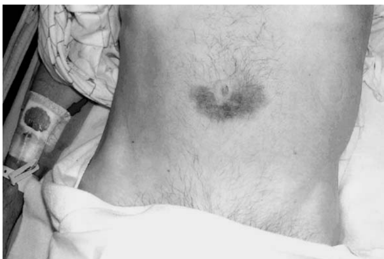
The American Journal of Medicine, 2005; 118:110.

Um homem de 42 anos de idade procurou o serviço de pronto atendimento, relatando dor epigástrica intensa com irradiação para todo o abdome, iniciada há 4 dias e acentuada nas últimas 6 horas. O exame clínico mostrou paciente agitado, com desconforto à palpação da região epigástrica, destacando-se a alteração mostrada na figura abaixo.