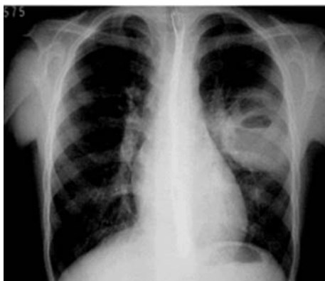
Moreira et al. J. bras. pneumol., 2006, 32(2), p. 14 (com adaptações).

Passadas 2 semanas do episódio relatado, o paciente observou febre vespertina de 38 °C, associada a tosse com escassa expectoração, com progressivo agravamento em uma semana, para eliminação de inodora secreção purulenta e dor torácica em pontada localizada em hemitórax esquerdo. O paciente retornou ao mesmo hospital, tendo o exame físico revelado adinamia, pressão arterial de 80 mmHg × 40 mmHg, sinais de gengivite e infecção dentária, frequência respiratória de 30 incursões por minuto, presença de som bronquial em porção medial do hemitórax esquerdo, bulhas taquicárdicas e sem sopros, ausência de visceromegalias e de edema ou de varizes em membros inferiores. O exame neurológico mostrou-se sem alterações. Os exames complementares apresentavam os seguintes resultados: hemograma – hemácias: 3.600.000/mm 3 ; hemoglobina: 10 g/L e hematócrito: 30%; leucócitos: 15.000 células/mm 3 , com 6% de bastões e 54% de neutrófilos. Bioquímica do sangue – glicose: 90 mg/dL; uréia: 35 mg/dL; creatinina: 1,2 mg/dL; TGO: 35 U/L e TGP: 40 U/L. Bacterioscopia do escarro: não foram identificadas bactérias (colorações de Gram e Ziehl-Neelsen). A radiografia de tórax (projeção postero-anterior) está apresentada na figura a seguir.