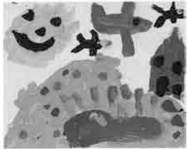
Elizabeth Newbery. Lago com patos, pássaros e sol. In: Como e por que se faz arte. São Paulo: Ática, 2005.

As crianças começam a desenhar e pintar ao mesmo tempo em que aprendem a falar. Na maioria das vezes, utilizam a arte como uma forma de expressão de algum sentimento ou mesmo como representação do que estão vendo. Com relação à análise do desenho de uma criança apresentado na figura acima, julgue os itens a seguir.