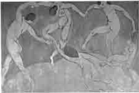
Henri Matisse. A dança , 1910. 2,60 m × 3,90 m. Museu Ermitage, Leningrado.

A arte do século XX — arte moderna — decretou que qualquer tema era adequado, libertou a forma das regras tradicionais e livrou as cores de representar com exatidão os objetos. Com relação às obras Guernica e A dança mostradas acima e as características da arte moderna, julgue os itens subseqüentes.