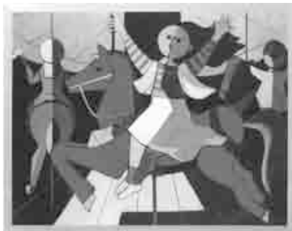
Milton Dacosta. Carrusel, 1952, 81 cm × 100 cm. Óleo sobre tela.

A leitura de uma imagem é uma das atividades desenvolvidas em sala de aula que contribui significativamente para elaborações perceptivas e reflexivas da criança. A partir da obra apresentada acima, do artista brasileiro Milton Dacosta, julgue os itens a seguir, relativos aos elementos visuais presentes nessa obra, entre eles a cor vermelha, que predomina na composição dos cavalos do centro e da esquerda, e a cinza, predominante nas roupas das figuras humanas.