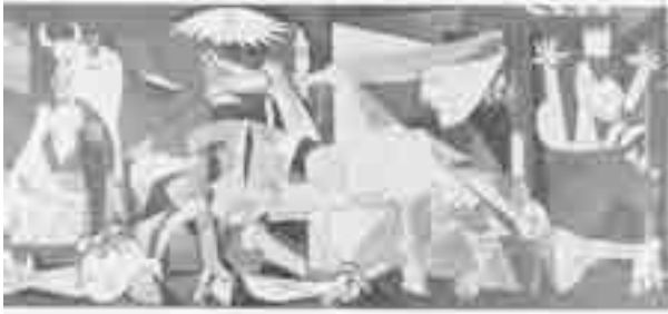
Pablo Picasso. Guernica , 1937. Têmpera sobre tela, 3,54 m × 7,82 m. Casón del Bom Retiro, Madri.