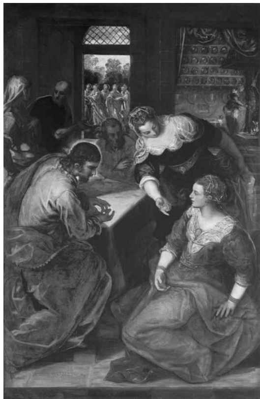
Figura II – Jacopo Tintoretto (1518-1594). Cristo na casa de Maria e Marta , óleo sobre tela. 197,5 cm x 131 cm, cerca de 1580.

Com base na comparação da pintura ilustrada na figura I, de Giovanni Bellini, com a pintura ilustrada na figura II, de Jacopo Tintoretto, dois pintores venezianos, e, considerando as transformações na pintura do Renascimento ao Maneirismo, julgue os itens seguintes.