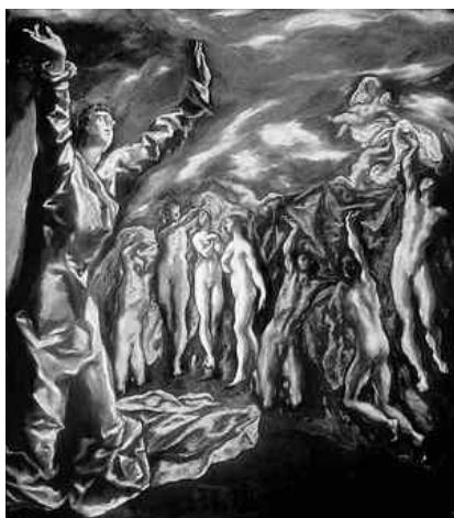
Figura III – El Greco (1541-1614). A abertura do quinto selo (ou "Visão de São João"), óleo sobre tela. 222,3 cm x 193 cm. 1608-1610. The Metropolitan Museum of Art.

Influenciado por Tintoretto durante sua estada em Veneza, El Greco realizou a pintura reproduzida na figura III. A partir da análise dessa figura, julgue os seguintes itens.