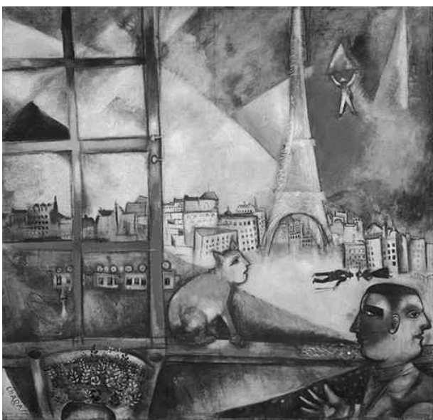
Figura VII – Marc Chagall (1887-1985). Paris através da janela, óleo sobre tela, 1913. Solomon R. Guggenheim Museum.

Julgue os itens a seguir, com base na comparação dos aspectos formais da pintura ilustrada na figura VI, de Vasily Kandinsky, com os da pintura ilustrada na figura VII, de Marc Chagall.