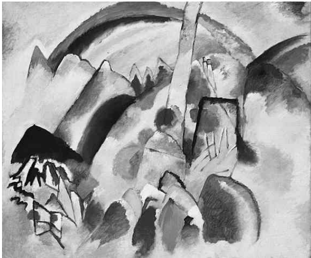
Figura VI – Vasily Kandinsky (1866-1944). Paisagem com pontos vermelhos, n.º 2, óleo sobre tela. 117,5 cm x 140 cm, 1913. Peggy Guggenheim Collection.