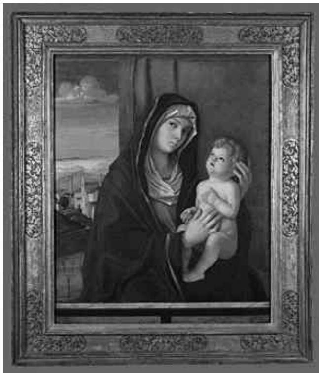
Figura I – Giovanni Bellini (ativo entre 1459 e 1516). Madona e menino , óleo sobre madeira. 88,9 cm x 71,1cm, cerca de 1480. The Metropolitan Museum of Art.