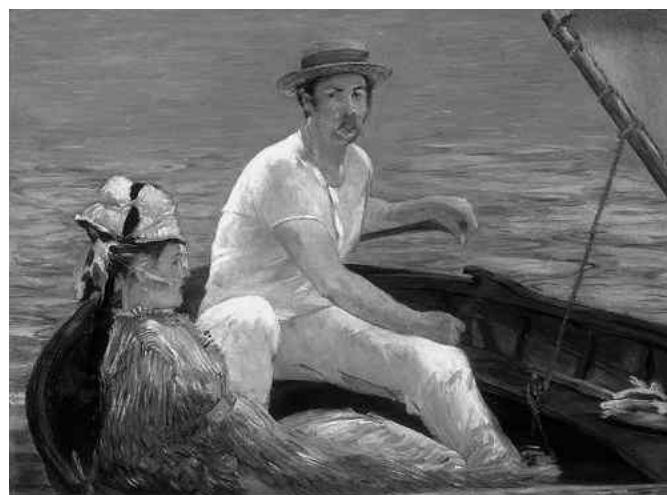
Figura V – Édouard Manet (1832-1883). Passeando de barco, óleo sobre tela. 97,2 cm x 130,2 cm, 1874. The Metropolitan Museum of Art.

Pode-se dizer que Manet e seus seguidores provocaram uma revolução na reprodução de cores que é quase comparável à revolução na representação de formas causada pelos gregos. Eles descobriram que, se olharmos a natureza ao ar livre, não vemos objetos individuais, cada um com sua cor própria, mas uma brilhante mistura de matizes que se combinam em nossos olhos ou, melhor dizendo, em nossa mente.