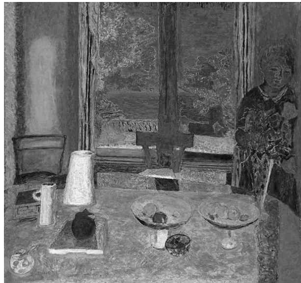
Figura VIII – Pierre Bonnard (1867-1947). Sala de jantar no jardim, óleo sobre tela, 1934-35. Solomon R. Guggenheim Museum.

Com relação à pintura pós-impressionista ilustrada na figura VIII, de Pierre Bonnard, julgue os itens subsequentes.