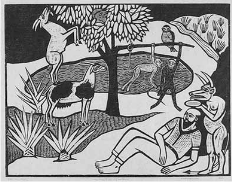
Gilvan Samico. Tentação de Santo Antônio , 34 cm × 45 cm, 1962.

A figura acima é uma ilustração de Gilvan Samico, cuja produção é particularmente representada pela recuperação do romancelheiro popular e pela literatura de cordel, povoada por personagens da bíblia, de lendas e por animais fantásticos. Assinale a opção em que é apresentada a linguagem artística desenvolvida por Gilvan Samico.