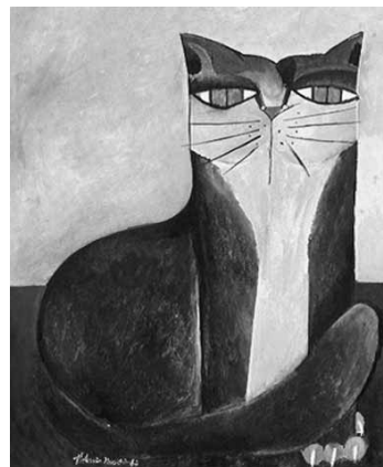
Gato Azul III, acrílica sobre tela, 55 x 46 cm, 1987.

A figura acima é uma ilustração de um artista do Modernismo, pertencente aos movimentos artísticos de maior importância na história das artes do Ceará. A produção desse artista é figurativa, e ele emprega um repertório formal constantemente retomado: aves, sobretudo os galos; cangaceiros, inspirados nas figuras de cerâmica popular; gatos, criados com linhas sinuosas; e, ainda, flores e frutas. Cores intensas e contrastantes também são empregadas em suas pinturas. Assinale a opção em que se apresenta o nome desse artista.