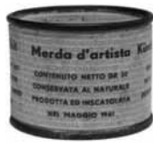
Merda do artista, 1961.