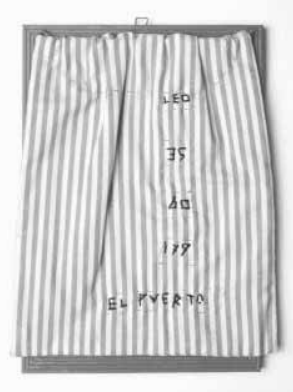
El puerto, bordado sobre tecido de algodão e espelho emoldurado, 1992, Coleção Família Bezerra dias.

A figura acima é uma ilustração de um artista cearense que fez sua breve carreira em São Paulo e dedicou parte de sua obra a bordados em tecidos. Nomes, listas, números, coleções, símbolos e repetições eram marcas nas obras desse artista, que, além da delicadeza das formas e a utilização de objetos do cotidiano, deixou seu registro e sua personalidade na arte contemporânea brasileira, de forma rápida, porém marcante e inconfundível. Assinale a opção em que é apresentado o nome do referido artista.