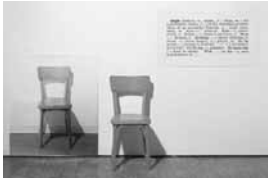
Uma e três cadeiras, 1965.