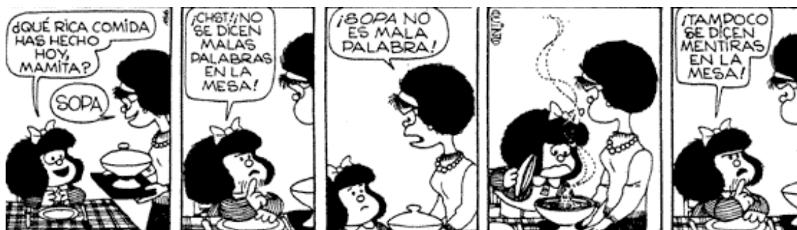
Joaquín Salvador Lavado (Quino). Mafalda .

Con respecto a la historieta de arriba — un diálogo entre la niña Mafalda y su madre —, es correcto afirmar que