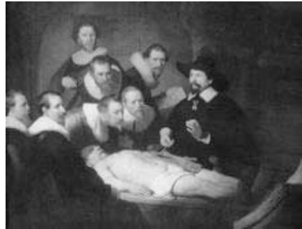
Rembrandt. The anatomy lesson of Dr. Nicolaes Tulp.

This text refers to questions 39 and 40.