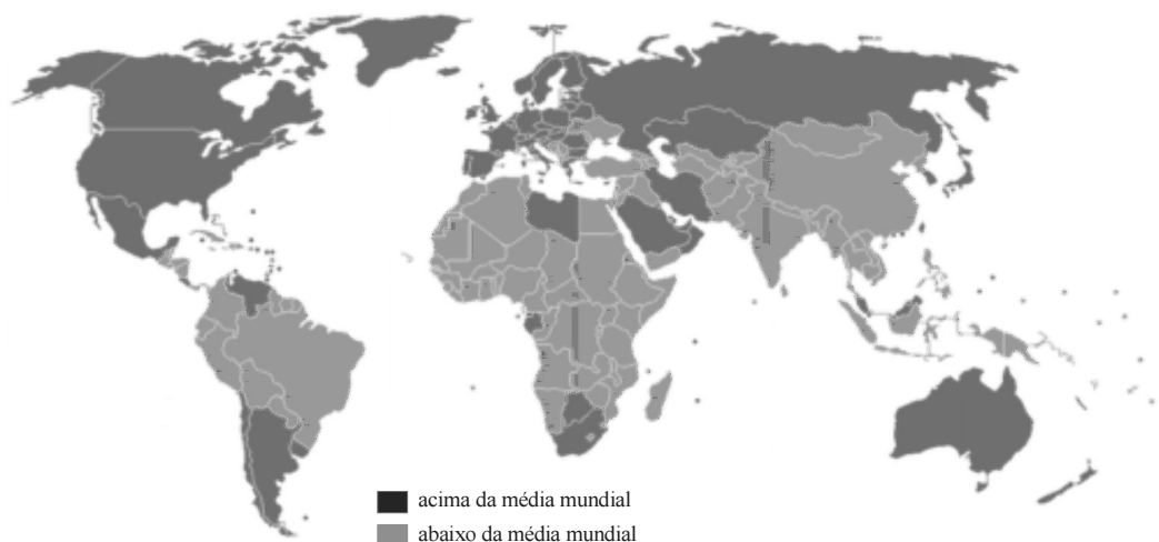
Figura para as questões 39 e 40