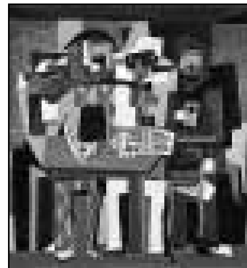
Figura I – Pablo Picasso (1881-1973). Três músicos , 1921. Philadelphia Museum of Art.

50 A forma verbal “são” (l.11) está empregada no plural para concordar com “formas” (l.11).