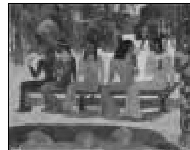
Figura II – Paul Gauguin (1848-1903). O mercado , óleo sobre tela, 73x91,5cm. Kunstmuseum, Basel.