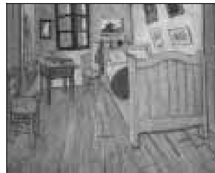
Figura III – Van Gogh. O quarto do artista em Arles , 1889. 57,5 x 75 cm. Óleo sobre tela. Museu d'Orsay, Paris.