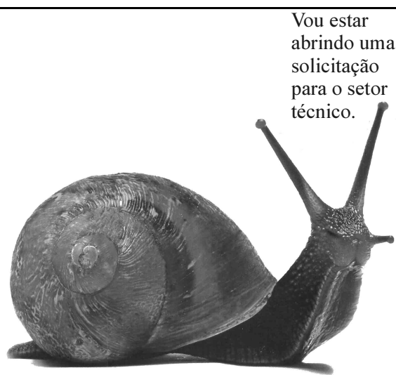
Superinteressante, out./2008, p. 50.

116 Os cursos de medicina e de matemática são escolhidos mais pelos homens que pelas mulheres.