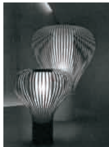
Patrícia Urquiola. Luminária Chasen . In: Arc Design , n.º 54, jun./2007.