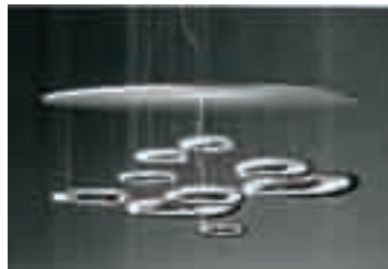
Ross Lovegrove. Luminária Mercury . In: Arc Design , n.º 54, jun./2007.

Recentemente, em Milão, foram apresentados ao público, na EuroLuce, Feira de Iluminação, alguns objetos que mostraram o design e a tecnologia voltados à criação de produtos que reflitam aspectos mais humanos: o design como manifestação exterior de uma necessidade interna, subjetiva; a razão dando lugar ao instinto, que passa a mover a criação. Considerando esse contexto e os produtos mostrados nas figuras acima, julgue os itens que se seguem.