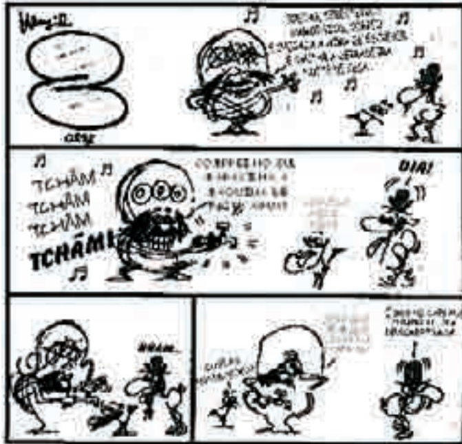
Centro Cultural Banco do Brasil. Henfil do Brasil , 2005, p. 32.

Considerando a história em quadrinhos acima como motivadora, redija um texto argumentativo, posicionando-se a respeito da afirmativa a seguir.