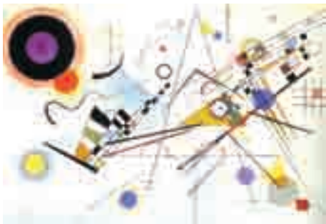
W. Kandinsky. Composição VIII . Óleo sobre tela, 140 cm x 201 cm. Museu Guggenheim, Nova York, Estados Unidos da América, 1923.

Os nomes das três obras de Wassily Kandinsky (1866-1944) apresentadas acima fazem referência à música. Com relação a essas obras e à música do século XX, julgue os próximos itens.