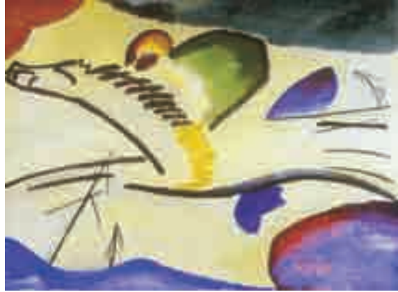
W. Kandinsky. Lírica . Óleo sobre tela, 94 cm × 130 cm. Museu Boymans-van Beuningen, Rotterdam, Holanda, 1911.