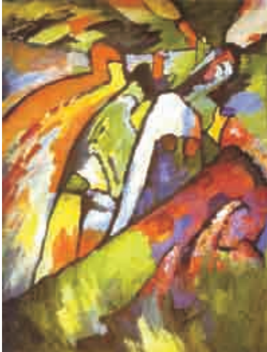
W. Kandinsky. Improvisação 7 . Óleo sobre tela, 131 cm × 97 cm. Galeria Tretyakov, Moscou, Rússia, 1910.