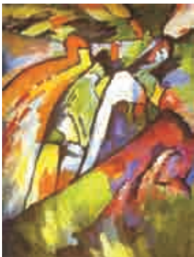
W. Kandinsky. Improvisação 7 . Óleo sobre tela, 131 cm x 97 cm. Galeria Tretyakov, Moscou, Rússia, 1910.