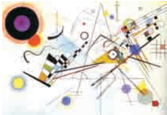
W. Kandinsky. Composição VIII . Óleo sobre tela, 140 cm × 201 cm. Museu Guggenheim, Nova York, Estados Unidos da América, 1923.

A partir das imagens acima, que apresentam obras do artista Wassily Kandinsky, julgue os itens a seguir, relativos a aspectos formais da pintura abstrata e às estruturas formais associadas à expressividade dos elementos encontrados nas referidas obras.