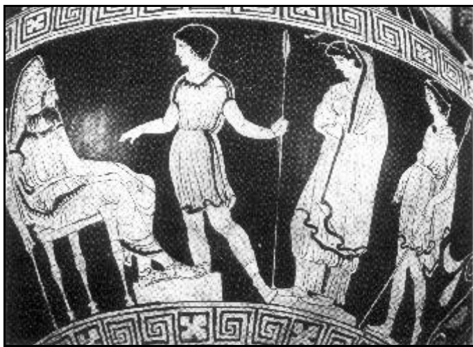
Cena da peça Antígona , de Sófocles, representada em vaso do ano 380-370 a.C. Mostra Antígona diante de Creonte, conduzida por dois guardas. In: Ancient Greece , p. 130.

Marilena Chaui. Introdução à história da filosofia , p. 114 (com adaptações).