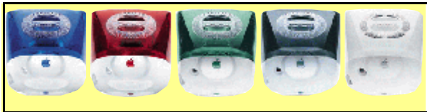
I-MAC – Idem.

Considerando o texto e as imagens acima, julgue os itens que se seguem.