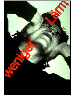
Josef Müller-Brockmann. Less noise, litografia, 1960.

Com base na reprodução dos cartazes acima, julgue os itens a seguir.