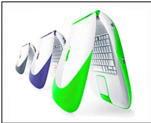
I-Book – Microcomputadores Macintosh.