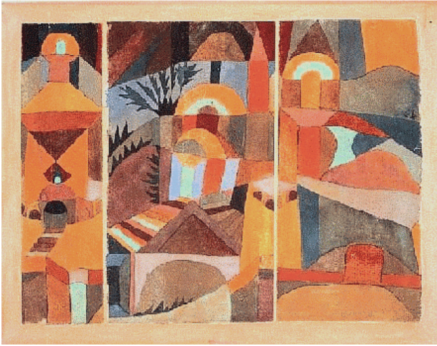
Paul Klee (1879-1940). Jardins do templo , guache sobre papel, 1920.

A pintura Jardins do Templo , reproduzida ao lado, parece aludir às impressões que Paul Klee obteve em sua viagem à Tunísia, em abril de 1914. O brilho das cores assemelha-se aos vitrais de uma janela em dia ensolarado. A respeito dessa obra, julgue os itens que se seguem.