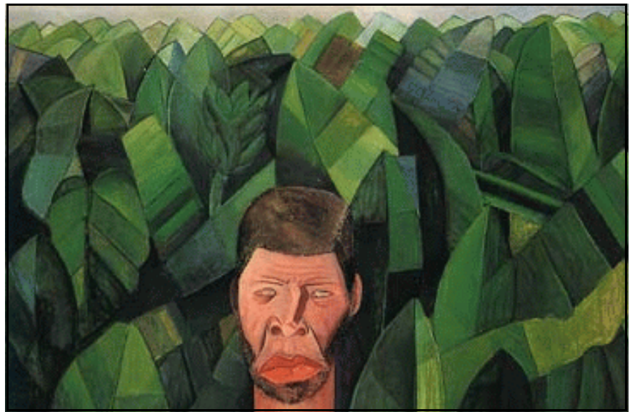
Lasar Segall. Bananal , óleo sobre tela, 1927.

Paulo Herkenhoff. XXIV Bienal de São Paulo. Núcleo Histórico: Antropofagia e histórias de canibalismos. São Paulo: Fundação Bienal de São Paulo, 1998 (com adaptações).