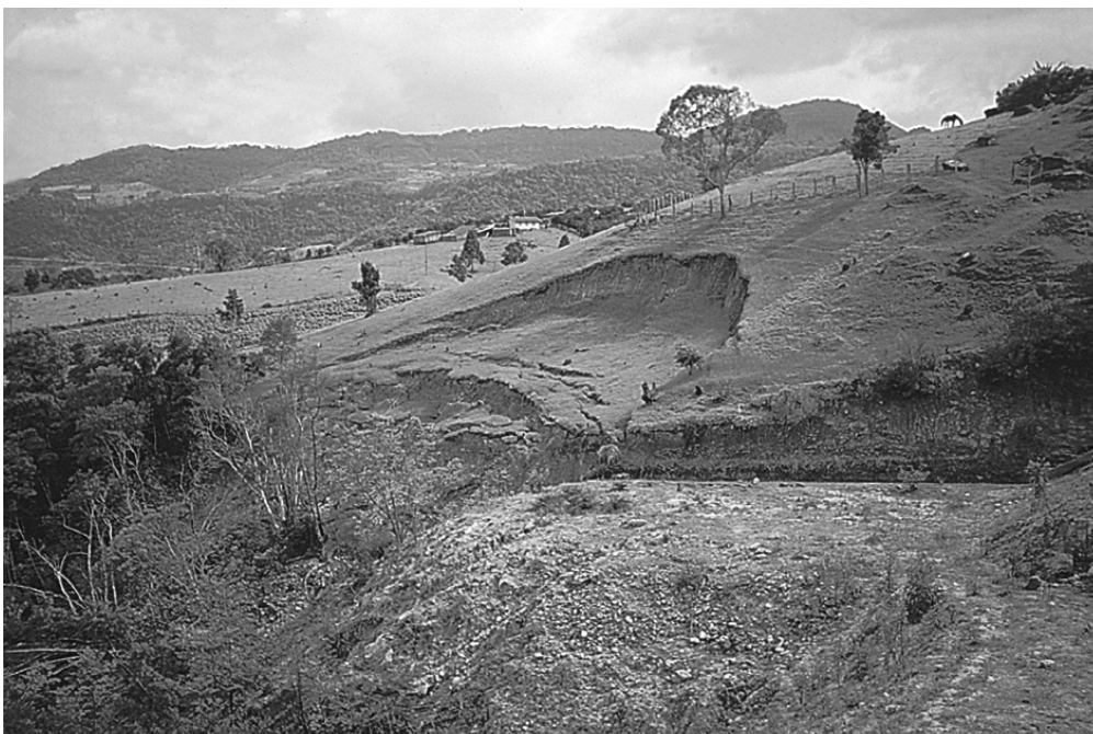
Cicatriz de escorregamento em encosta

Considerando que a figura acima representa uma cicatriz de escorregamento em encosta, redija um texto em que esse processo de escorregamento seja descrito e suas causas sejam apresentadas.