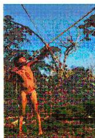
Figura III – Anna Bella Geiger. Brasil nativo/Brasil alienígena , nove cartões postais dispostos em colunas paralelas (detalhe): fotos do Brasil Alienígena de Luiz Carlos Velho; fotos do Brasil Nativo , em cor, cedidas pela Mercator; em preto e branco, cedidas pela Manchete, 1977.