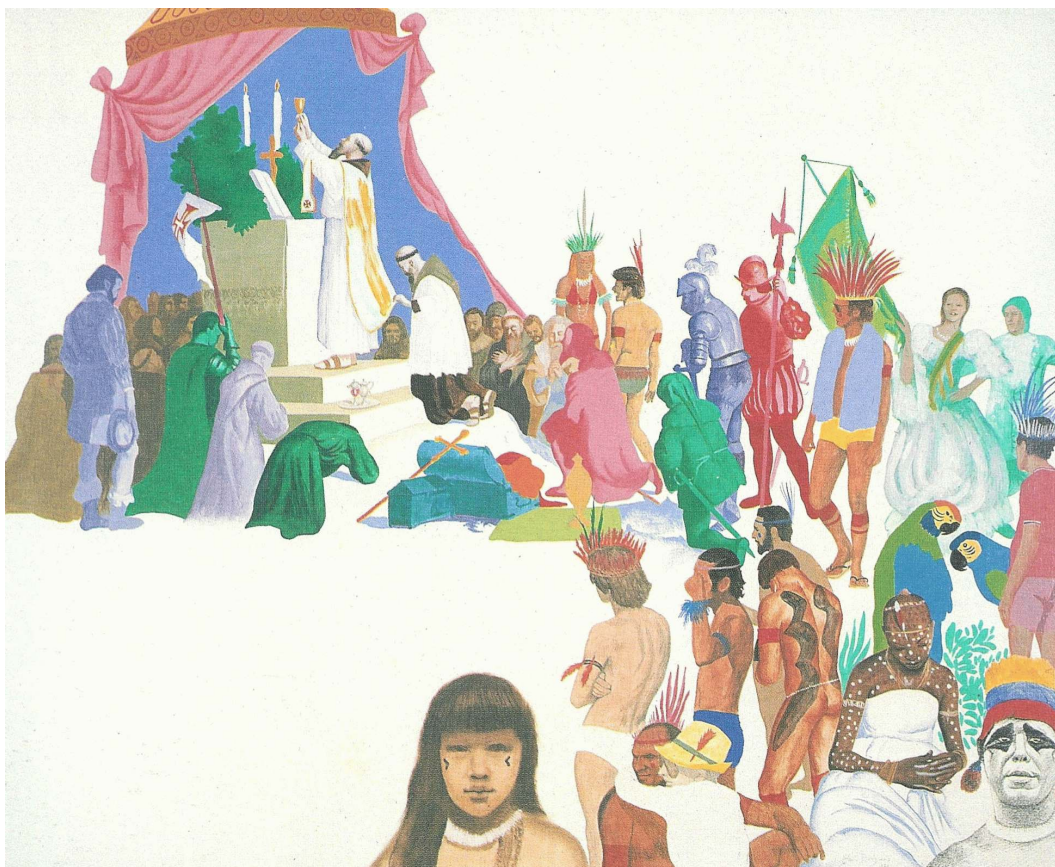
Glauco Rodrigues. Primeira missa no Brasil , 1971, 81cm × 100 cm, tinta acrílica sobre tela. Coleção Gilberto Chateaubriand, Rio de Janeiro.

Observe na pintura de Glauco Rodrigues acima como o artista trabalha a relação figura-fundo. Com base na estratégia utilizada por esse autor, realize uma composição bidimensional utilizando o material que você trouxe e as figuras inseridas nas páginas de 4 a 6 deste caderno de prova. Você poderá utilizar, entre outros, os seguintes procedimentos: deformar, interferir, inserir, transformar, colorir, interpretar, colar, copiar, desenhar, recortar, rasgar, pintar etc. Para isso, destaque as páginas de 4 a 6 do caderno.