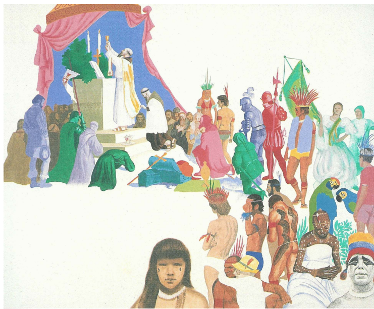
Figura II – Glauco Rodrigues. Primeira missa no Brasil , 1971, 81 cm x 100 cm, tinta acrílica sobre tela. Coleção Gilberto Chateaubriand, Rio de Janeiro.