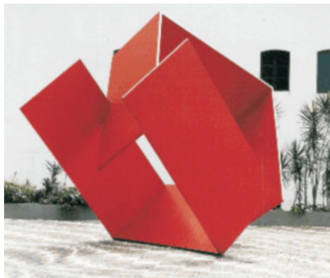
Figura II – Franz Weissmann. Encontro , 1983, 450 cm × 400 cm × 200 cm, aço pintado. Conjunto Universitário Cândido Mendes, Rio de Janeiro.