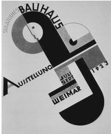
Joost Schmidt. Cartaz para a exposição da Bauhaus, 1923.

O objetivo último de toda a atividade artística é a construção! (...) Arquitetos, pintores e escultores precisam reaprender a conhecer e a entender a multiplicidade de aspectos da construção, em sua totalidade e em suas partes, pois só assim eles mesmos poderão preencher suas obras com um espírito arquitetônico, que perderam em meio à arte de salão.