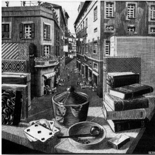
Maurits Cornelis Escher. Still Life and Street , 1937, xilogravura, 48,7 cm x 49 cm, Cornelius Van S. Roosevelt Collection.

Considerando a figura acima, discorra sobre os fundamentos da linguagem visual utilizados por Escher para compor essa obra. [valor: 1,50 ponto]